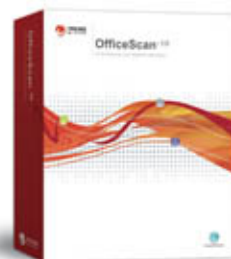
趋势科技防毒墙网络版 - OfficeScan 10